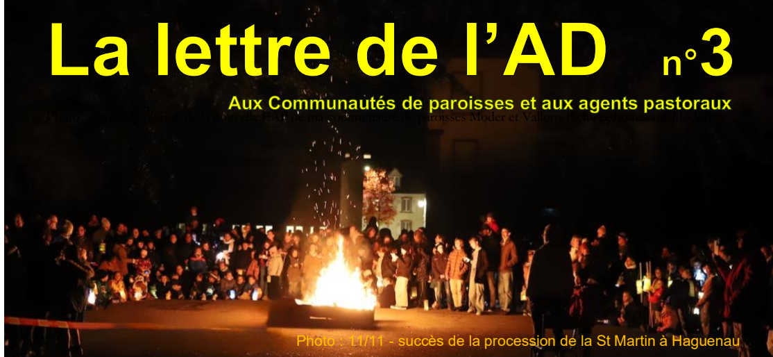
Photo : 11/11 - succès de la procession de la St Martin à Haguenau

Date à retenir pour les collégiens, profession de foi et confirmands : Samedi 14/3 après-midi. Des infos suivront !